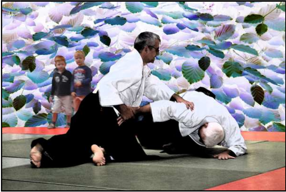
Sankyo parmi le feuillage bleu d'un automne lumineux